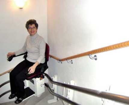
Der Holzhandlauf in Ergänzung zum Treppenlift

Ecken, Wandvorsprünge und Nischen sind für die Montage von Flexo Handläufen kein Problem. Selbst Wendeltreppen können komplett mit ihnen ausgestattet werden. Viele Treppen(-häuser) sind nur mit einem Geländer über der schmalen und somit gefährlichen Trittfäche der Stufen versehen. Mit dem zweiten Wandhandlauf von Flexo erhalten Sie mehr Sicherheit!