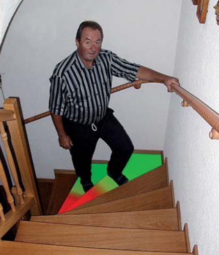
Sicheres Gehen. Rot markiert die gefährliche schmale Trittfäche, grün die sicherere Seite, auf der sich der Außenhandlauf befindet.