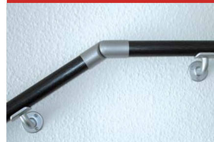
Hochwertige Verarbeitung für dauerhaften Einsatz

Der Handlauf besteht aus einem stabilen Stahlrohr mit 35 mm Durchmesser und ist in eine hochwertige Laminierung gefasst. flexofit ist erhältlich in z. B. Buche hell, Nuss mittel, schwarz/silber, edelstahloptik, Wurzelholz, weiß, grün und rot; Zusätzlich auch als griffiger Massiv-Buche-Handlauf mit quergereiffelter Oberfläche erhältlich. Durch das einmalige Baukastensystem kann Flexofit schnell an jede örtliche Gegebenheit angepasst werden und dient nicht nur Ihrer Sicherheit, sondern sieht auch gut aus.