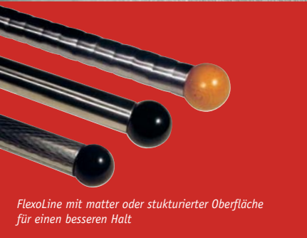
FlexoLine mit matter oder strukturierter Oberfläche für einen besseren Halt