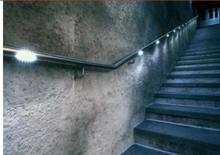
Handlauf mit integrierter LED-Beleuchtung

Die Licht-Module werden flächenbündig in die Rohre einarbeitet und beleuchten zielgerichtet ihre Treppenstufen. Mit geringem Verbrauch und einer Haltbarkeit von rund 50.000 Stunden können Sie zwischen verschiedenen Farben wählen. Durch verschiedene Winkel weist das Licht blendfrei auf Gefahrenquellen hin. Somit dient dieser Handlauf nicht nur der Sicherheit, sondern auch als Gestaltungselement für modernes Bauen und Wohnen.