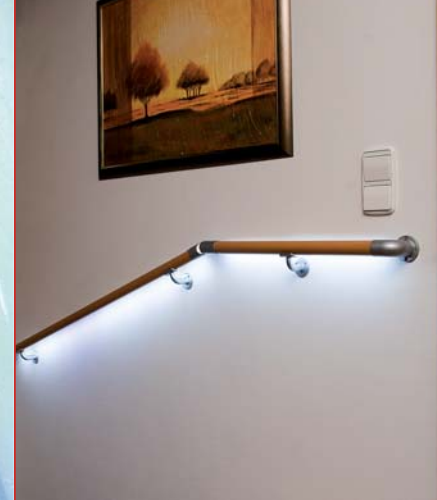
Indirekte Ausleuchtung der Treppe mit LED-Technologie