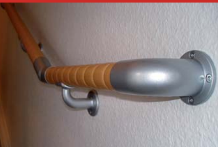
Auch in 35 mm griffigem Massivholz erhältlich